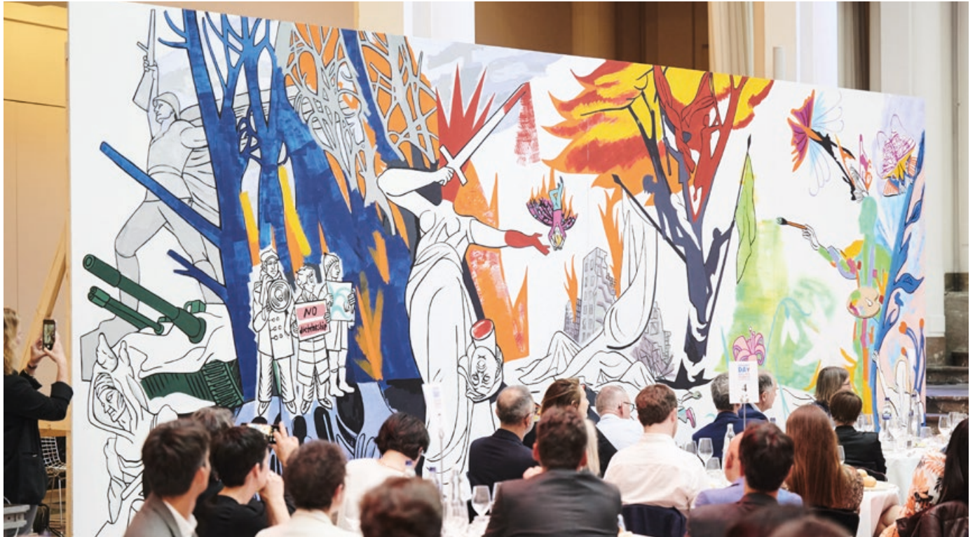
Een muurschildering van de gevluchte Russische cartooniste Victoria Lomasko over de oorlog in Oekraïne werd begin mei 2022 tijdens Difference Day, de dag van de persvrijheid, in Brussel tentoongesteld

De serie focust op problematieken wereldwijd, maar is ook een reflectie op onze eigen maatschappij.