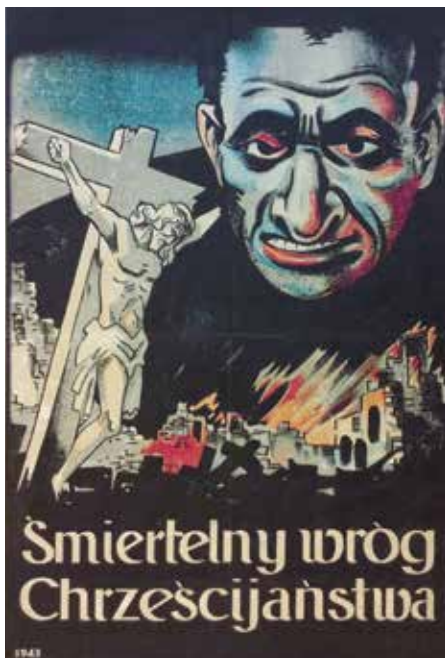
"De aartsvijand van het christendom" (Polen, 1943)

Rudi Vranckx: "Het is een illusie dat je de wereld kan veranderen zonder kennis van zaken over het terrein, en de VS hadden geen plan voor na de invasie. Noch politiek, noch economisch, noch over de machtsverdeling. De Midwest-mentaliteit valt ook niet zomaar over te plaatsen naar ginder.