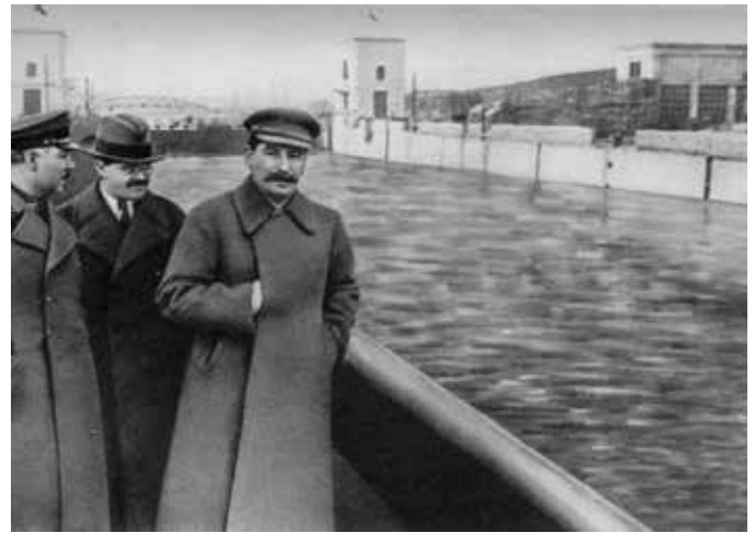
Volkscommissaris Nikolaj Jezjov (rechts, naast Jozef Stalin) tuimelde van zijn hoge positie in de Sovjet-Unie. In 1939 werd hij geëxecuteerd en nadien uit de archieven gewist

dementie. Meestal beschouwen we de ziekte als een vijandige indringer - een dief of sluipmoordenaar tegen wie we moeten strijden. Tegelijk is de diagnose een soort doodsvonnis: de nadruk wordt gelegd op het eindpunt, iemand sterft al terwijl hij er nog is. Heel anders kan de beleving zijn als het 'dood'-frame geruild wordt voor het 'pluk de dag'-frame, met de nadruk op wat er wél nog is en kan. De 'vijand' wordt dan een 'vreemde reisgezel', iemand met wie je leert samenleven. Je merkt meteen hoeveel impact de woordkeuze kan hebben op hoe je iets bekijkt en ervaart.